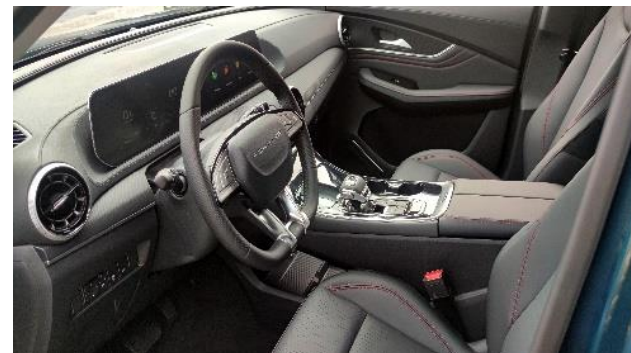
TAPICERKA SKÓRZANA JEDNOBARWNA CZARNA