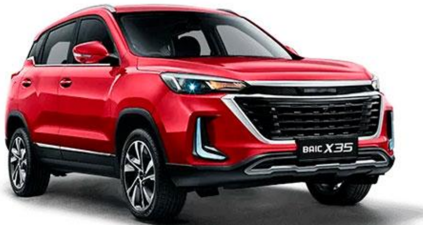
Baic Beijing X35 1.5L Turbo 116km