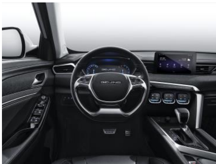
Tapicerka materiałowa szara