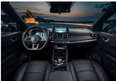
TAPICERKA SKÓRZANA CZARNA